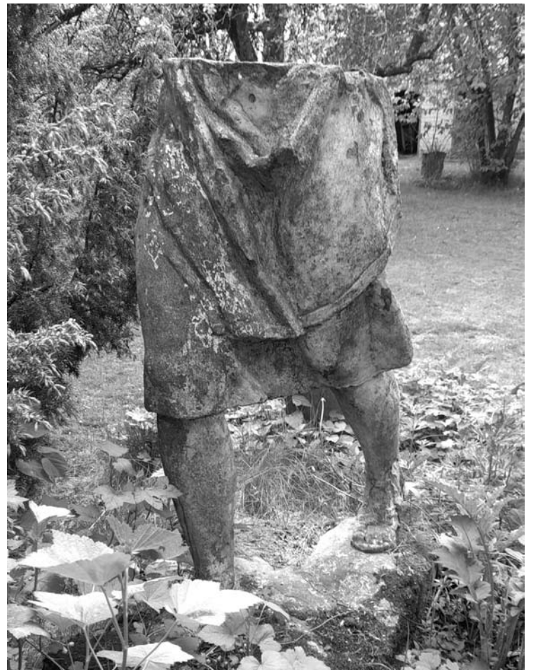
Taip atrodo skulptūros likutis, stovintis vieno kavarskiečio kiemo gale, ne itin atviroje vietoje.

85-erių Antano Sunklodo nuomone, skulptūros pastatymu galėjo užsiimti „Nuga-