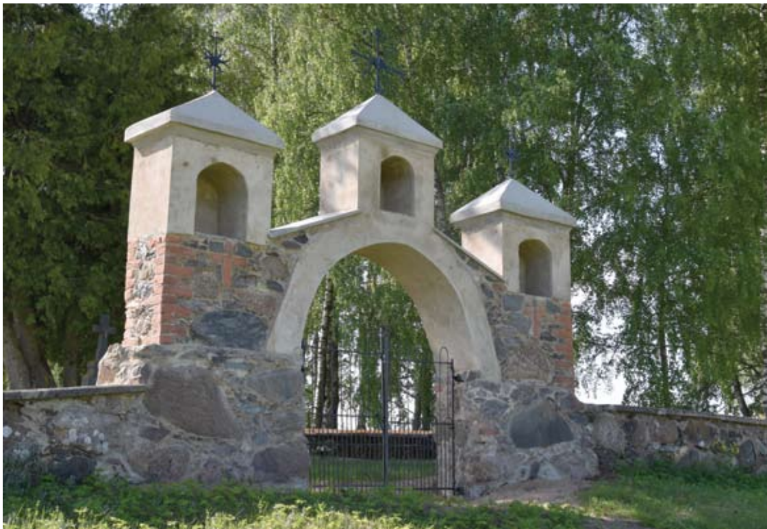
Kunigiškių I kaimo kapinių vartai taip atrodo dabar.