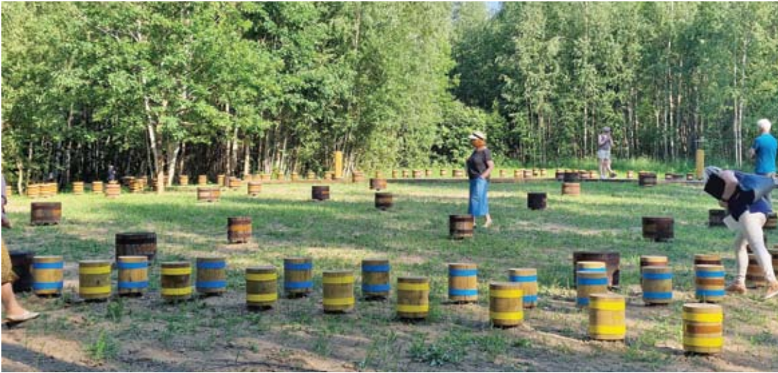
Viena iš Storių pažintinio tako atrakcijų – pagal mastelį iš kaladžių išdėlioti Lietuvos kontūrai.