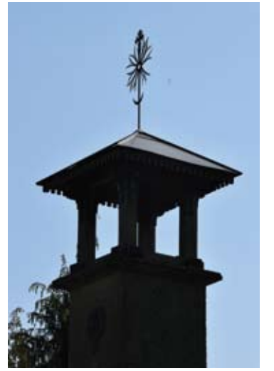
Po šiais paminklais, šalia koplytėlės-varpinės, ilsisi Drobčiūnų miške nelygioje kovoje kritusių septynių Lietuvos partizanų palaikai.