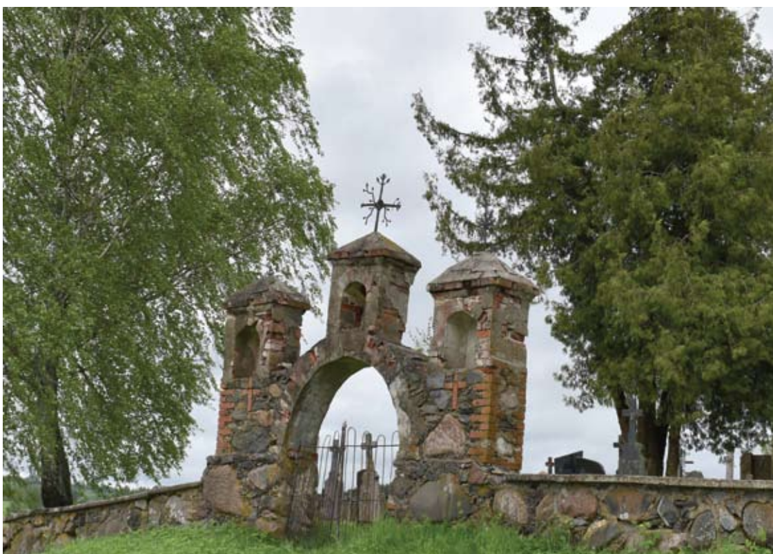
Taip dar neseniai atrodė kapinių vartai, kurie jau kėlė pavojų ir bet kada galėjo išgriūti.

palaidoti 1949 metų lapkričio 2 dieną Drobčiūnų miške nelygioje kovoje su sribais ir NKVD garnizono kareiviais žuvę septyni Lietuvos partizanai, kurių išniekinti kūnai Svėdasų miestelio pakraštyje buvo sumesti į gyventojų bulvėms ir daržovėms laikyti iškastas duobes. Laisvės gynėjų artimieji nakčia žuvusiųjų palaikus pervežė į Kunigiškių kaimo kapines ir čia palaidojo. Ilgą laiką, baiminantis, kad sovietinių laikų aktyvistai neišniekintų partizanų kapų, apie čia palaidotus žmones buvo nutylima, jų amžinojo poilsio vieta tik minimaliai prižiūrima, kukliai aptvarkoma. Tikėtai Atgimimo metais susirūpinta Laisvės kovotojų atminimą įamžinti ir jų kapus sutvarkyti. 1991 metais kapinių pakraštyje iškilo originalus statinys – koplyčia-varpinė primenantis paminklas, o ant septynių partizanų kapų pastatyti antkapiniai paminklai-stelos.