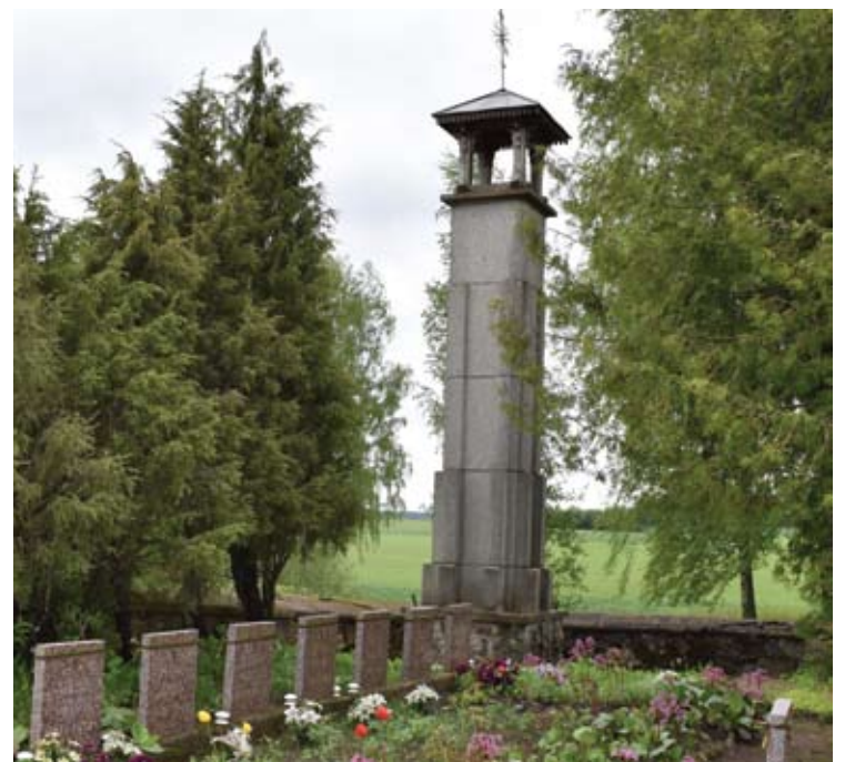
Šalia koplytėlės-varpinės ilsisi Drobčiūnų miške kritusių septynių Lietuvos partizanų palaikai.

Kunigiškių I kaimo kapinaitės tebeveikiančios, jose atgula amžinojo poilsio ne tik tai kunigiškietė, bet ir kaimynai iš Rokiškio rajono Kamajų seniūnijos Ažubalių kaimo.