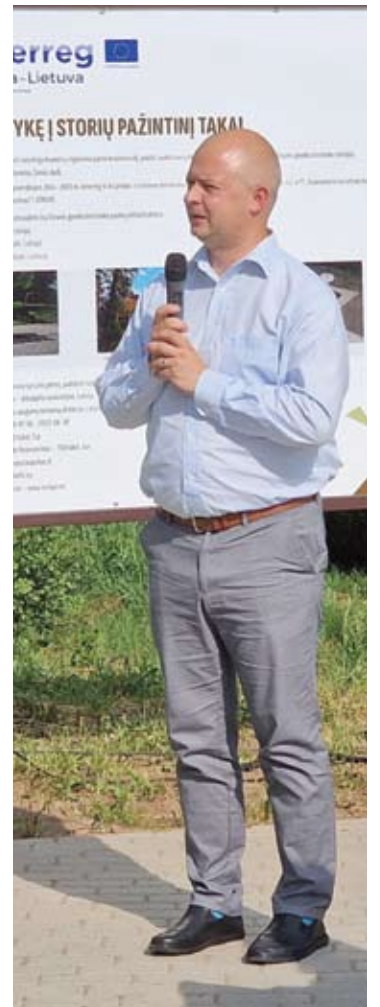
Aplinkos ministras Simonas Gentvilas ironizavo, kad dar ir dabar yra manančių, jog žemė plokščia.

Matavimai buvo labai tikslūs – paklaida tebuvo 3 milimetrai vienam kilometrui.